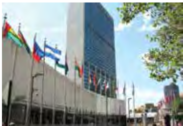
БҰҰ штаб квартирасы. Нью-Йорк.

Екінші дүниежүзілік соғыс біткеннен соң, 1945 жылғы 24 октябрде Сан-Франсискода (АҚШ) 51 мемлекет әлемдегі тыныштық пен қауіпсіздікті сақтау мақсатында БҰҰ-ның Жарғысына қол қойды, оны шын мәнінде «Тыныштық конституциясы» деп атауға болады.