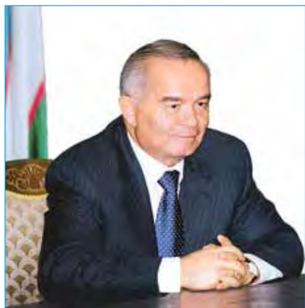
Ислам Каримов – Первый Президент Узбекистана

С ПРАЗДНИКОМ, ДНЁМ НЕЗАВИСИМОСТИ РЕСПУБЛИКИ УЗБЕКИСТАН!